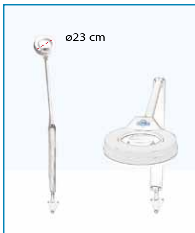
Attacco a parete cod. CH/CIR/R/102

CIRCLELED è disponibile nelle versioni con attacco a parete, a tavolo, grazie ad un comodo morsetto e a stativo su ruote.