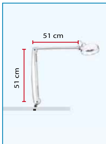
Attacco a tavolo cod. CH/CIR/R/103